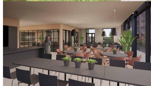
Kantine med møterom i bakgrunnen